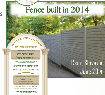
Csuz, Slovakia June 2014