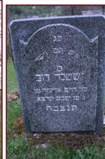
Tombstone of Harav R' Yisoscher Dov, son of R' Chaim Eliezer z"l

Size: B, Condition of fence: Wire fence, durable fence urgently needed, Total # of tombstones: 33, Condition of tombstones: neglected