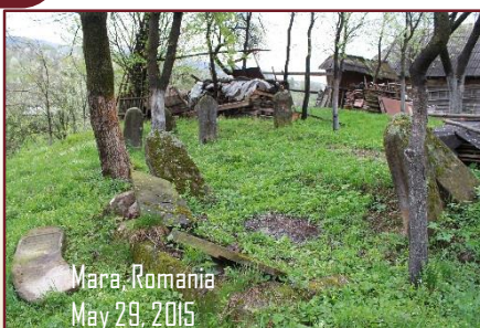
Mara, Romania May 29, 2015

פ"נ אשה חשובה מ'ו חיי פרימור מ'ו נפתלי נ' א תמוז תרס"ט תנצבה פ"נ איש תם וישר ירא ד' ר' דוב ב"ר יצחק נפטר מ'ו כסלו שנת תרס"ו תנצבה