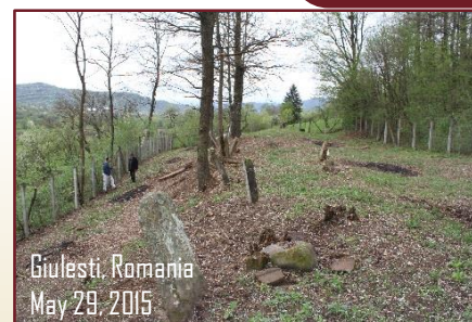
Giulesti, Romania May 29, 2015

Condition of fence: No fence, durable fence urgently needed, Total # of tombstones: 18, Condition of tombstones: neglected