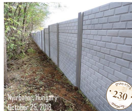
Nyirbator, Hungary October 25, 2018