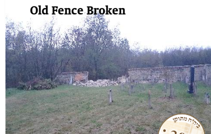
Old Fence Broken