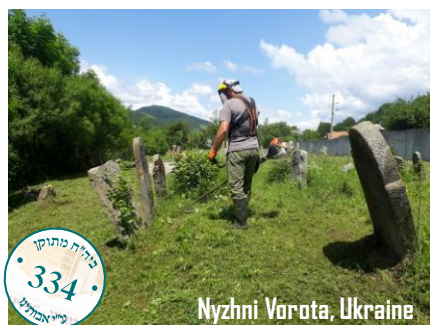
Nyzhni Vorota, Ukraine

Headed by the descendants Details will follow