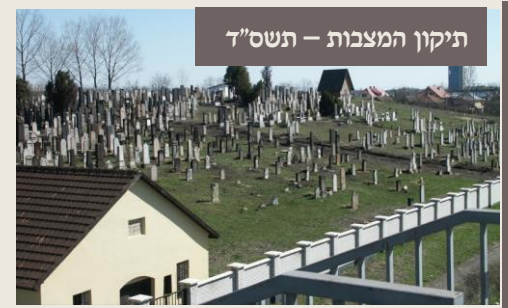
תיקון המצבות - תשס"ד

קורצע איבערבליק אויף די מסי'נדיגע פעולות פון די חברי הוועד, וואס האבן איבערגעבויעט א גרויסן טייל גדר און איבערגעבויעט דעם אוהל, און אויפגעשטעלט לערך 1,500 מצבות. בראשות הוועד של צאצאי יוצאי העיר, ה"ה אנשים חשובים, תלמידי חכמים ויראי ה', ומפורסמים בצדקתם ואמונתם, כבוד שמים מפארים, מילידי קליינווארדיין ז"ל, ועל צבאם הני אנשי מעשה, יקרי ערך הרה"ג המופלג חסיד שבכונה רבי יוסף צבי הכהן פערל ז"ל הרבני התורני נכבד ומפואר רבי שמואל אבא גראס ז"ל