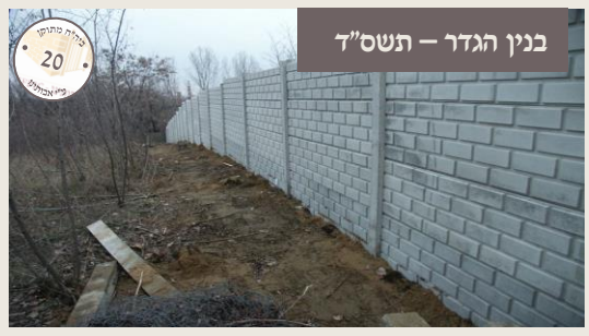
בנין הגדר - תשס"ד