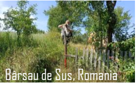
Barsau de Sus, Romania

לעצטע פאזע פון בוי-ארבעט צו פארמאכן דעם ביה"ח'ס פערטע וואנט