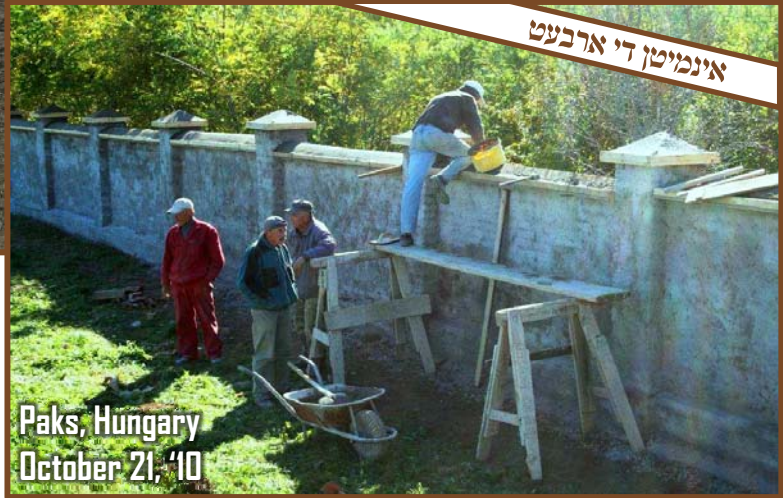
Paks, Hungary October 21, '10