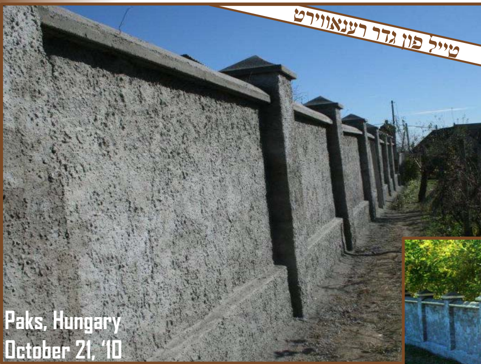
Paks, Hungary October 21, '10

"כי כל הפצים לא ישוו אל ההשארה הזאת אשר היא אחרית האדם ותקותיו" (מתור"ד המלבי"ם ז"ל בפרשתן חיי שרה עיי"ש באורך)