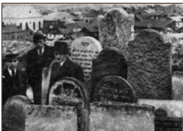
מצב הביה"ח כהיום:

ביה"ח איז אין א שרעקליכער מצב מיט אפענע עצמות ר"ל! בילדער פון ביה"ח פאר'ן קריג און היינט: