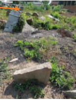
מצבת הרה"ח ר' יהושע יצחק ז"ל